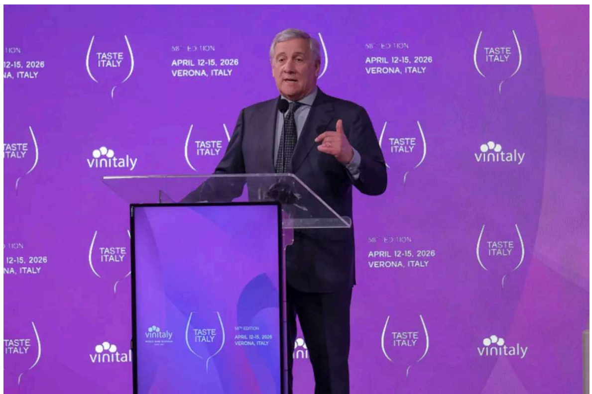
L'intervento di ieri a Vinitaly del vice presidente del consiglio Antonio Tajani

In generale, secondo Coldiretti, il vino italiano vanta un valore complessivo di 14 miliardi di euro e il settore conta 241.000 imprese vitivinicole attive su 681.000 ettari, con una forte vocazione alla qualità: il 78% della superficie è destinato alle Indicazioni Geografiche. Sul piano internazionale, gli Stati Uniti - che assorbono circa il 23% dell'export vinicolo italiano - hanno penalizzato le aziende del settore con dazi e condizioni di mercato sfavorevoli, secondo l'organizzazione agricola. Il 2025 si è chiuso con un calo del 9% in valore, mentre il 2026 è iniziato con una flessione del 35% a gennaio e del 21% a febbraio, seguita da segnali di parziale ripresa a marzo. Per Coldiretti, eliminare gli ostacoli rappresentati da burocrazia, dazi ed etichette allarmistiche consentirebbe di recuperare fino a 1,6 miliardi di euro per le imprese vitivinicole italiane. Risorse che potrebbero essere reinvestite in qualità, innovazione, enoturismo e promozione sui mercati internazionali.