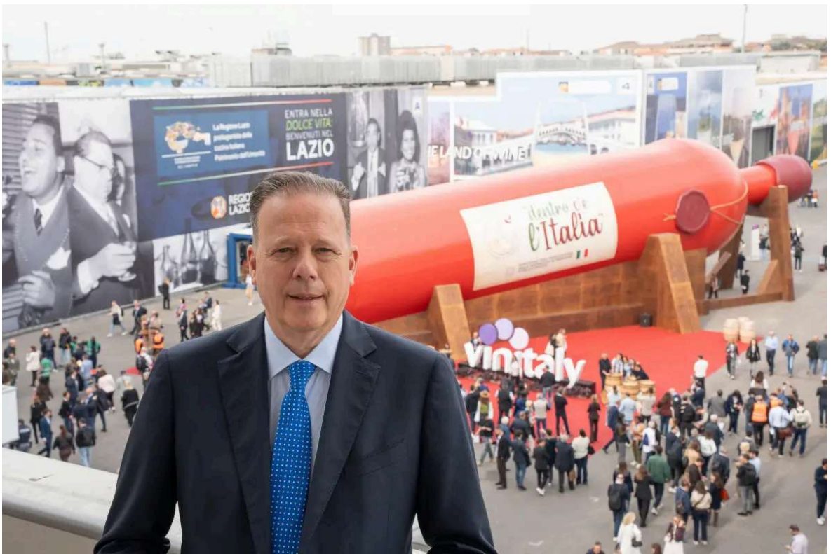
Il presidente di Veronafiere Federico Bricolo davanti all'ingresso di Vinitaly 2026

Con queste parole, il presidente di Veronafiere Federico Bricolo ha inaugurato Vinitaly 2026 , evidenziando il ruolo della manifestazione come hub strategico per il vino italiano e per il consolidamento della sua presenza sui mercati globali. Il piano di sviluppo prevede oltre trenta iniziative internazionali, con focus su Stati Uniti, Asia, America Latina ed Europa, e nuove tappe in Africa, Canada e Australia, oltre al rafforzamento della presenza in Brasile. Secondo l' Osservatorio Uiv-Vinitaly , i mercati con maggiore potenziale di crescita includono Giappone, Corea del Sud, Cina, India e Vietnam , accanto a Stati Uniti e Regno Unito. L'obiettivo è ampliare il bacino commerciale di un comparto ancora concentrato su pochi mercati chiave, migliorando il posizionamento internazionale e la competitività.