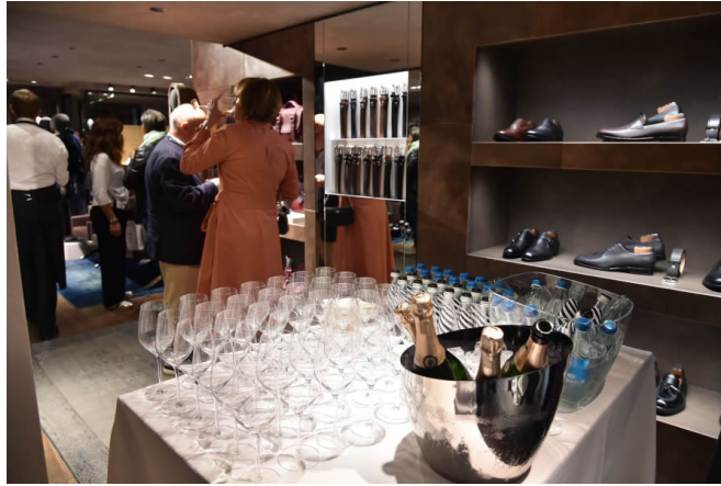
La Vendemmia di Roma porterà esperienze gourmet, fashion e design.