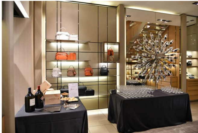
La Vendemmia di Roma 2019 si terrà dal 14 al 20 ottobre (Foto © La Vendemmia di Roma).

Il vino che “fa sistema” con moda, cibo e ospitalità, i quattro pilastri del made in Italy di eccellenza, per una settimana di degustazioni, assaggi e incontri all’insegna del buon vivere